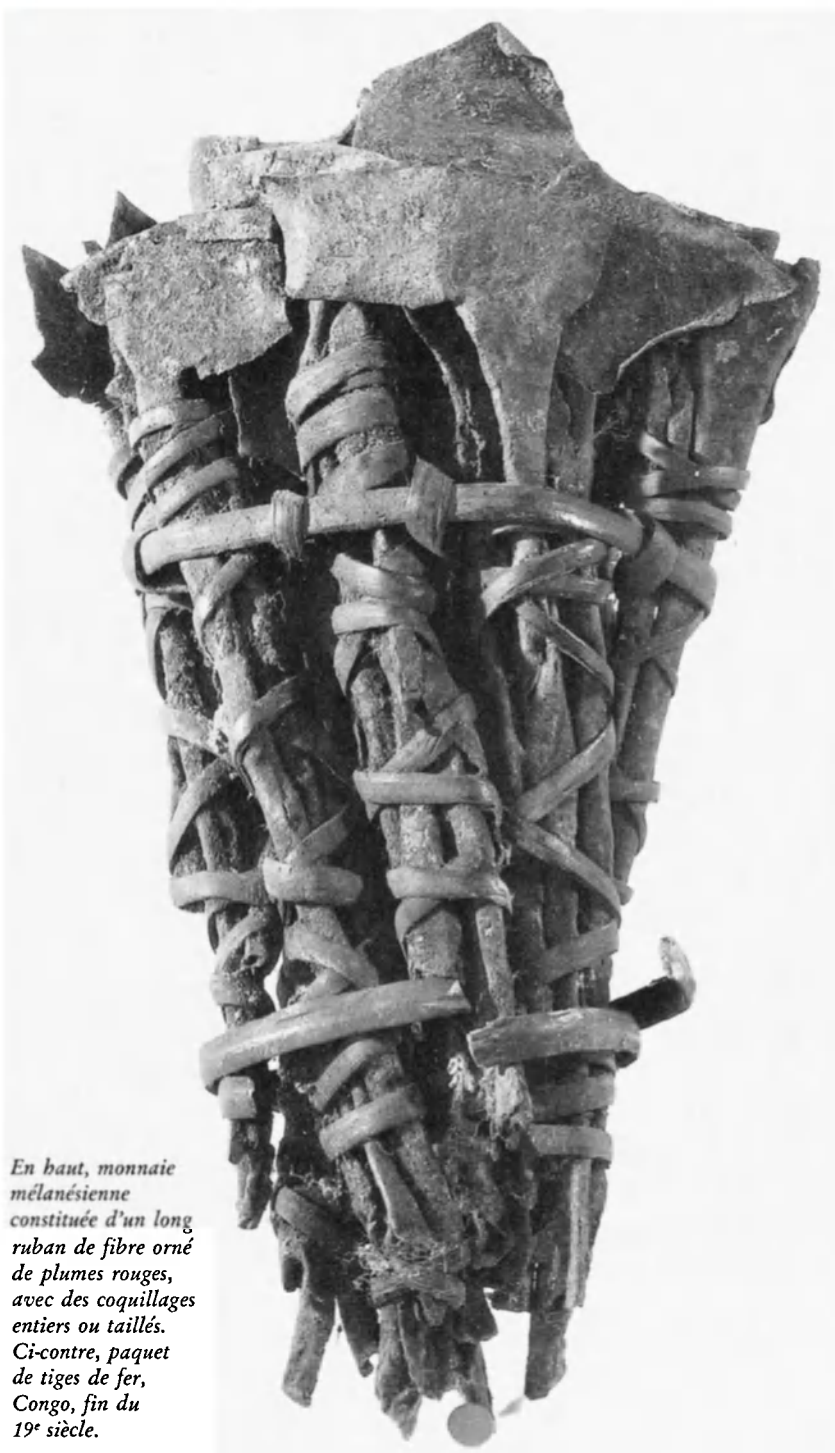
En haut, monnaie mélanésienne constituée d'un long ruban de fibre orné de plumes rouges, avec des coquillages entiers ou taillés. Ci-contre, paquet de tiges de fer, Congo, fin du 19 e siècle.