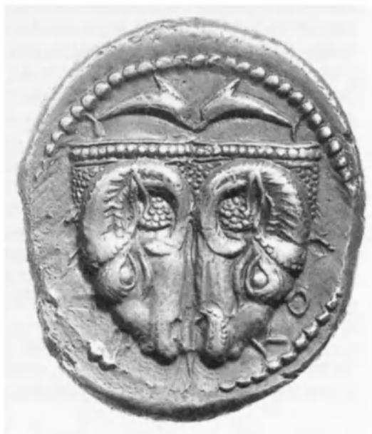
De haut en bas : guerrier entre deux bœufs, octadrachme macédonienne du début du 6 e siècle av. J.-C. ; le cheval de Mende, statère grec en argent (Macédoine, 5 e siècle av. J.-C.) ; avers et revers d'une tétradrachme carthaginoise en argent (4 e siècle av. J.-C.) ; avers et revers d'un décadrachme frappé à Syracuse (v. 400 av. J.-C.) ; les bœufs de Phocide, statère grec en argent (v.479-470 av. J.-C.).