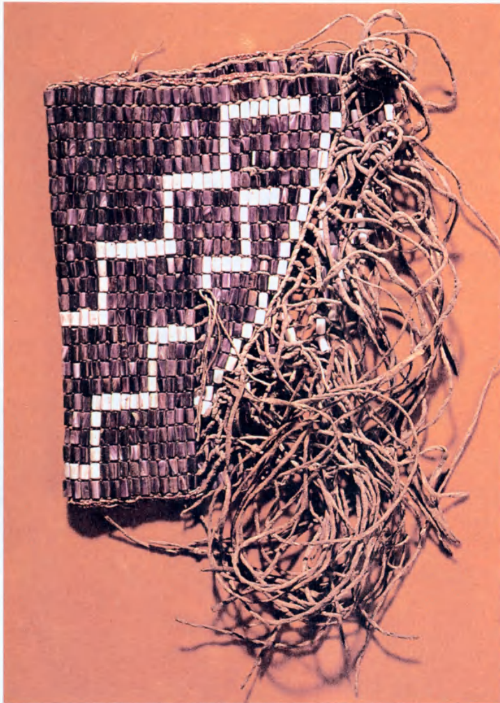
A gauche, fer forgé en forme de couteau de jet ayant fait office de monnaie, République centrafricaine. Ci-contre, un wampun, objet en peau et perles de nacre dont les Indiens d'Amérique du Nord se servaient dans leurs transactions avec les Blancs aux 17 e et 18 e siècles. Ci-dessous, ensemble d'objets utilisés dans l'archipel mélanésien des îles Salomon pour la fabrication de monnaies de coquillage.